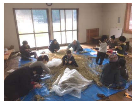
わらに囲まれてしめ縄づくり

「3本目は、このあいだに入るように、同じ方向にねじりながらいれこんでいくのよ。」