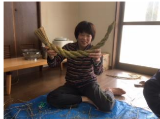
ベテランさんのしめ縄はいつも立派！