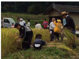
刈って、束ねて、運びます。

くらなび農園の管理人さんや地元の農家さんからの差し入れ(さつまいものじくの佃煮、お葉漬け、山椒の実の佃煮、かき餅、柿など)、さらに鯖江の人参を使った人参ジャムと食パンがテーブルに並び、この地ならではの馳走を味わいました。いつ雨が降ってくるかと空を見上げながらの作業でしたが、屋外での作業中は雨が降ることもなく、スムーズに無事終了することができました。農作業して、おなかいっぱい！さつまいものお土産もついて、大満足の一日でした。