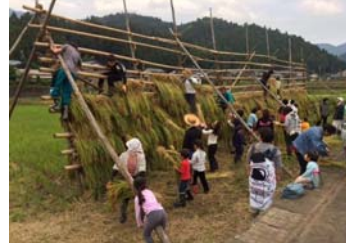
ハサ場に稲をかけて、干します。