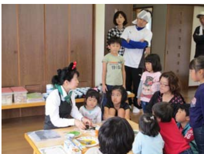
子どもさんに優しくレクチャー。