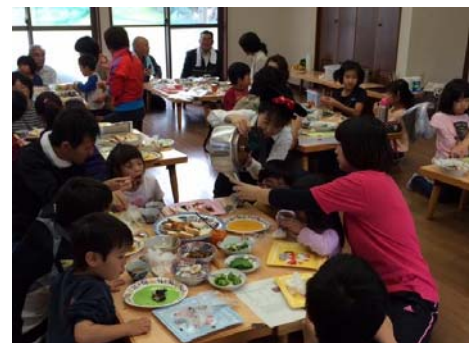
農園のめぐみを、おなかいっぱい いただきました！