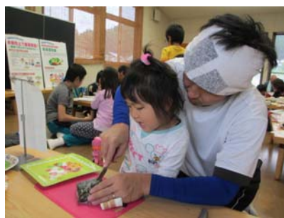
子どもさんも、やる気满满！