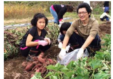
さつまいもの収穫に大満足！