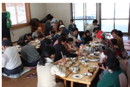
農園のめぐみに感謝し、いただきます〜す!