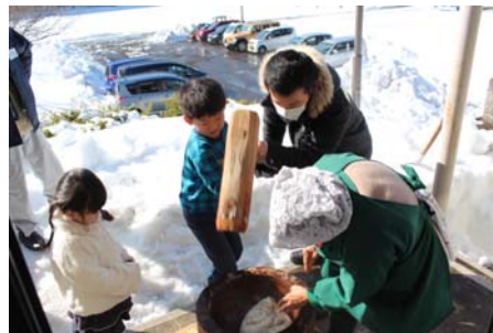
お父さんと一緒にぺったん、ぺったん。