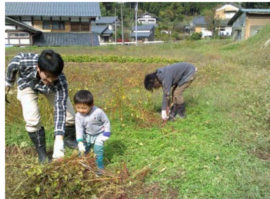
子どもさんもお手伝い。