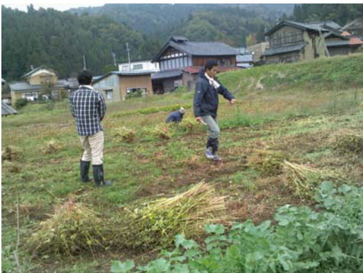
雨で延期でしたが、ようやくソバが刈れました。

収穫量が少なく、来年に蒔くそばの種の量しかないとのことで、今年のそば打ちはできません。残念！