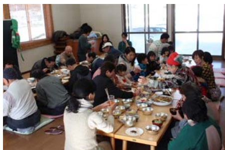
農園のめぐみに感謝し、いただきます～す!