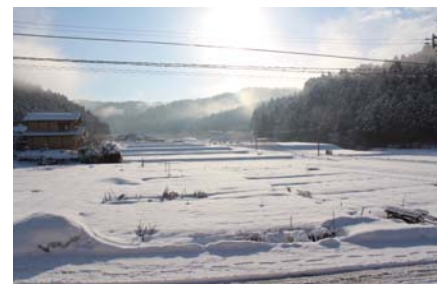
農園がある尾花町の田畑は雪に埋もれています。感謝祭の日は青空も広がりました。