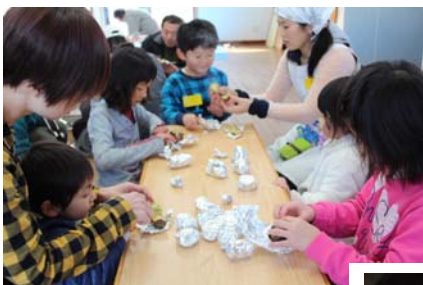
焼き芋をみんなで試食! ほっくり、おいしい!