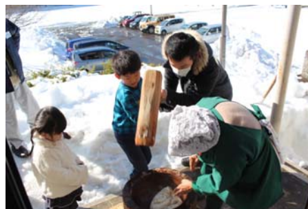
お父さんと一緒にぺったん、ぺったん。