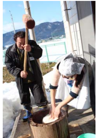
“臼とり”初体験!来年もよろしく!

くらなび農園の1年間の実りに感謝して『もちつき』『里芋もち』『焼き芋』『いのしし汁』をみんなで一緒につくり、おいに食べ、楽しく交流しました。