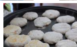
里芋とお米でつくった里芋もちを、ホットプレートで焼きます。