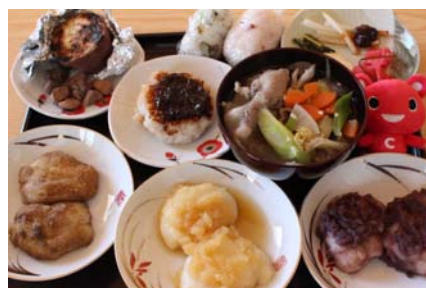
焼き芋、里芋もち、いのしし汁、おろし餅、きな粉餅、ぼた餅、おむすびにお漬物。ここでしか味わえない、とびきりのごちそうです!