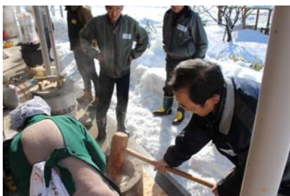
地元の方は、慣れた手つきでもちつき開始。