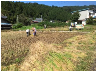
稲刈り後の田んぼにはたくさんの赤とんぼが飛び交っていました。