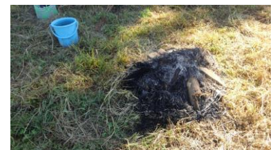
焼き芋もできて大満足!

次回くらなび農園は11月6日(日) そばの刈り取り、20日(日) 春用野菜の苗植えを予定しています。天候によっては、日程が変更になる場合があります。農園登録されている方には、その都度ご案内します。