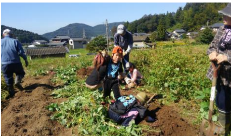
大きなサツマイモを次々と掘り起こしました

サツマイモ掘りを2日間にかけて行いました。大きいサツマイモが収穫でき、大満足です。