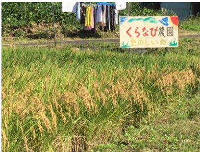
よく実った農園の田んぼ

14時30分頃に、無事作業終了。少ない人数での稲刈りに見かねて手伝ってくださった地主さんは言います。「稲刈りもはさば掛けも大変なんです。だから農家はみんなコンバインでするんです。」米づくりの大変さを実感した一日でした。