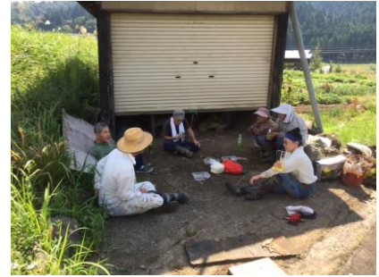
しばしの休憩タイム。 気温が高く、休みながらの作業。