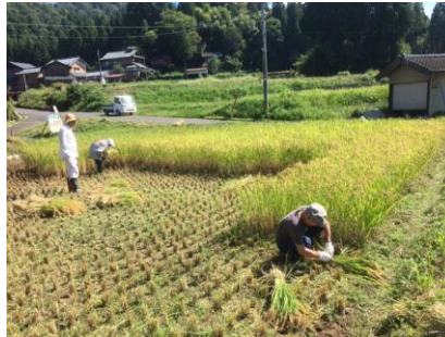
参加人数が少ない中、必死で稲刈り