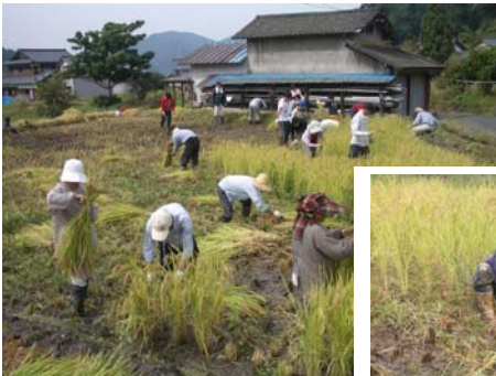
子どもさんもお手伝い。

稲刈りに先立って、学生さんにはキクナ・小松菜・大根などの間引き、さつまいもの収穫体験もしていただきました。