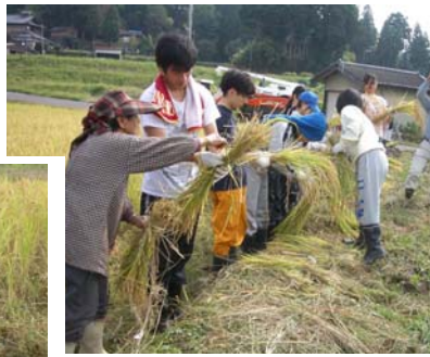
刈った稲を束ねるのが難しい！