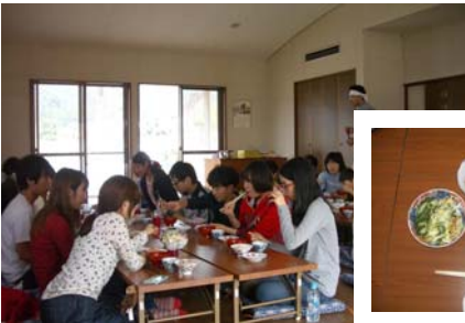
農園のめぐみをいただきま〜す！