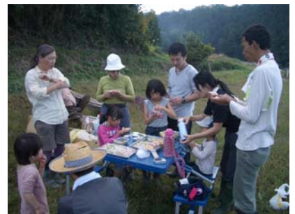
収穫の後は、さつまいものおやつタイム

次回くらなび農園は11月2日(日)。そばの刈り取りを予定しています(雨天中止)。