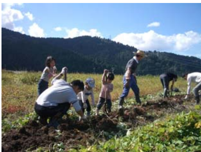
みんなでさつまいも掘り！

バケツ一杯のさつまいもが本日のお土産です。水菜、小松菜、こかぶも収穫してお土産に。さつまいも掘りが終わった後、越前カンタケの栽培講習会を行い、みんなでさつまいものおやつを楽しみました。