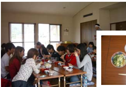
農園のめぐみをいただきます！