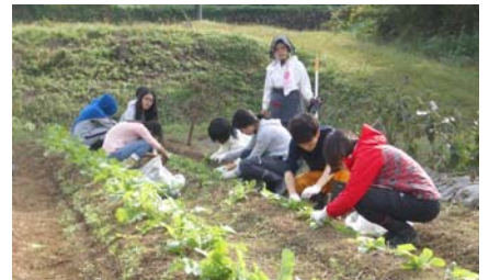
学生さんには、キクナ、小松菜などの間引きもしていただきました。