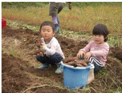
バケツ一杯のさつまいもはお持ち帰り