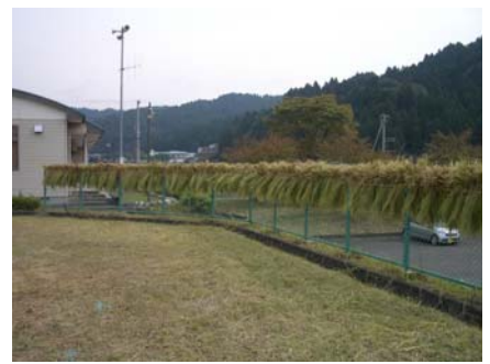
わらは干して、しめ縄づくりに使います。