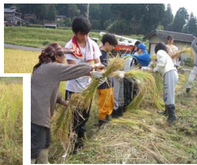
刈った稲を束ねるのが難しい！