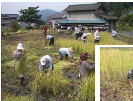
子どもさんもお手伝い。

稲刈りに先立って、学生さんにはキクナ・小松菜・大根などの間引き、さつまいもの収穫体験もしていただきました。